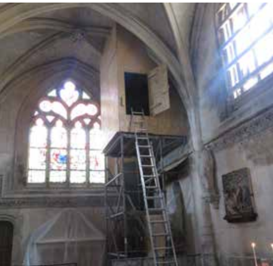
L'emplacement du vitrail fait l'objet d'une protection particulière.

Après la restauration des baies qui a nécessité la fermeture de l'église Saint-Jacques durant plusieurs semaines, c'est désormais au tour d'un vitrail de bénéficier d'une cure de jouvence.