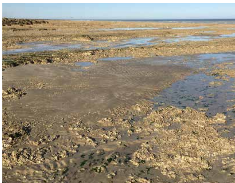
Les moulières ont presque disparu en quelques années.

À ce jour, l'augmentation spectaculaire du taux de mortalité des moules (il peut atteindre jusqu'à 100 % sur certains secteurs) n'est pas clairement expliqué. L'Ifremer travaille sur le sujet.