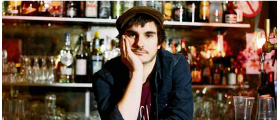
Gauvain Sers sera la vedette du grand concert de l'été programmé le 18 août.

La Ville du Tréport, par le biais de sa commission culturelle municipale, propose de nombreuses animations tout au long de l'été. Voici le programme. L'accès est gratuit et ouvert à tous.