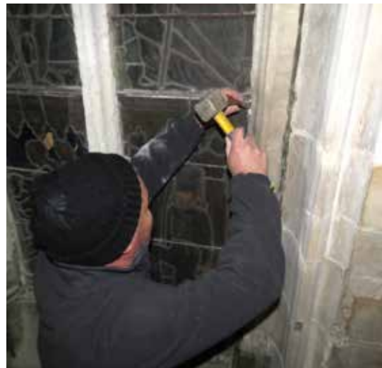
Le vitrail a été minutieusement enlevé par un spécialiste.