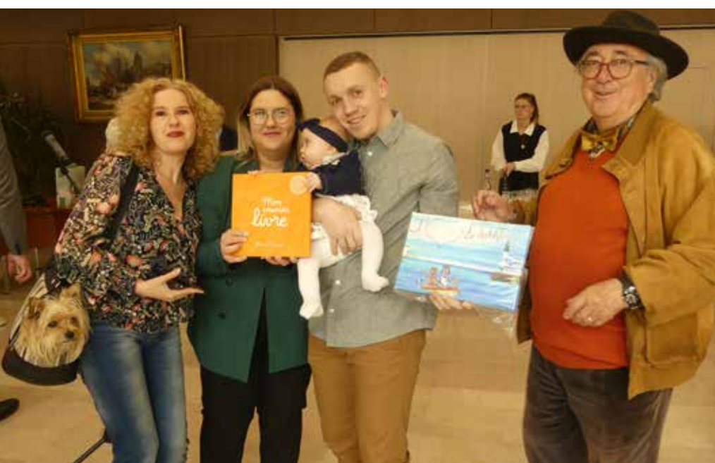
Chaque enfant a reçu «mon premier livre» et une œuvre signée de JC Courchay.

23 petits Tréportais ont vu le jour l'année dernière. Leurs heureux parents ont été invités au début du printemps à se retrouver en mairie pour une cérémonie conviviale.