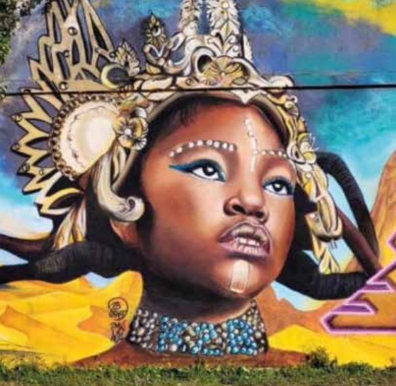
À La Rochelle.

même chose... le vandalisme en moins », se réjouit-elle. Elle le pratique surtout avec beaucoup de talent.