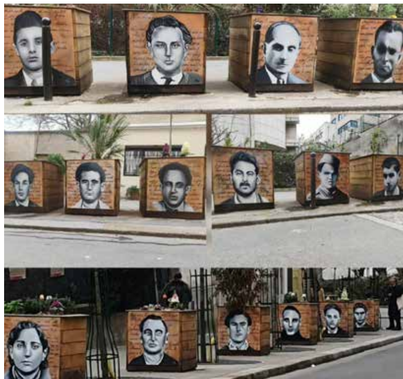
Rue Manouchian, Paris 20e.

« Vous aviez vos portraits sur les murs de nos villes », a écrit Louis Aragon dans la chanson « L'affiche rouge », en référence à l'affiche placardée par les nazis en 1944. Grâce à Fanny, ces portraits aujourd'hui placés à la vue de tous rendent au groupe, l'hommage que ses membres méritent.