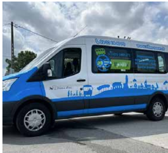
Le TAD est un service gratuit ouvert aux habitants de la CCVS.

puis recherchez «Villes Sœurs Mobilité». « My Mobi » sur Apple store et sur Google Play.