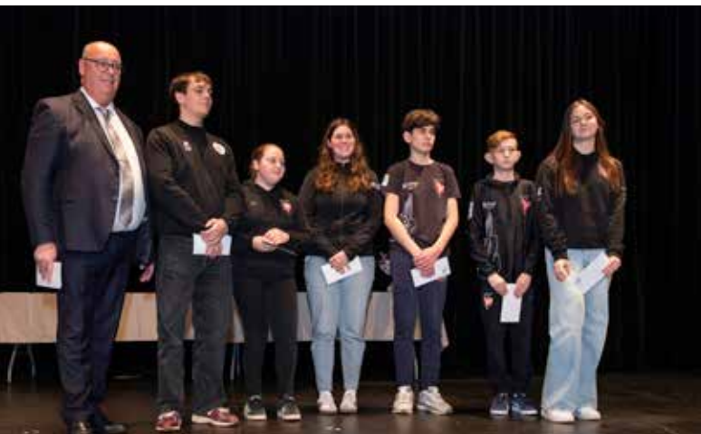
La cérémonie des vœux de la municipalité à la population est suivie de la remise des récompenses aux sportifs. Chaque club détermine la liste de ses adhérents qu'il souhaite mettre à l'honneur, comme ici, ceux de l'AST Full-Contact ou de l'AST Football.